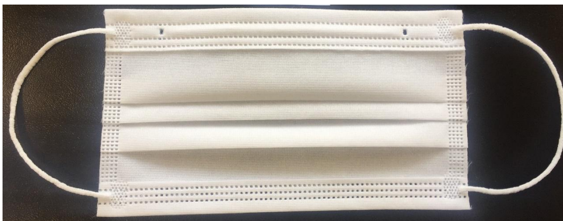
Imagem do Produto:

Máscara de proteção nível 2 com elásticos laterais, três dobras e clip nasal para ajuste. Composta por 1 camada de tecido. Não estéril. Reutilizável até 10 lavagens.